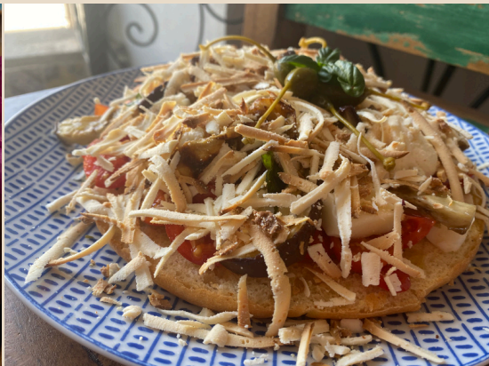
Pane Cunzato Ricotta Infornata