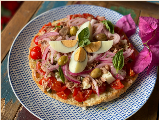
Pane Cunzato Classico

Pomodorini, pesto di pistacchio, formaggio primo sale al pistacchio, prosciutto crudo, rucola e granella di pistacchio.