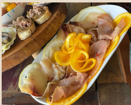
Tagliere di Mare