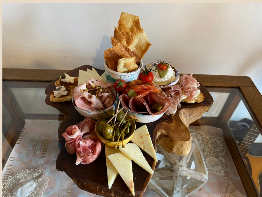
Tagliere di Terra